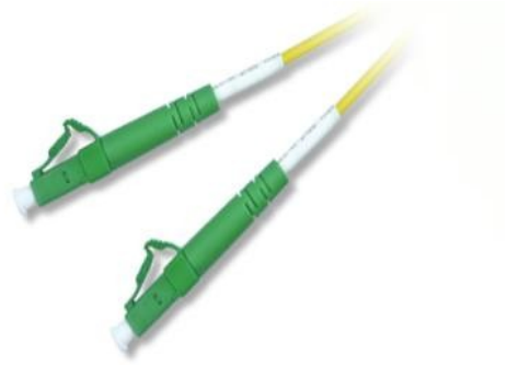
LC (APC) Singlemode